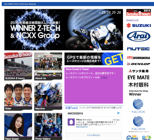
WINNER Z-TECH & NCXX Group Official Site

また、皆様に Team「WINNER Z-TECH & NCXX Group」を応援して頂く為に、応援サイト『WINNER Z-TECH & NCXX Group Official Site』( http://www.ncxx-sl.co.jp/8tai/ )を立ち上げました。レース開催期間 (2015 年 7 月 23 日～26 日) 限定のコンテンツ等も用意しておりますので、是非ご覧頂き、応援をお願い致します。