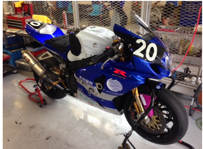
WINNER Z-TECH & NCXX Machine

*1 Team「WINNER Z-TECH & NCXX Group」は、Team「WINNER Z-TECH」にネクスグループが協賛をすることで新たに生まれ変わった Team です。ネクスグループの持つ通信技術を活かしたデータ収集、分析により、効率の良い走行や安全な走行の実現を目指します。