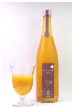
黄いろのトマト100%ジュース

また、トマトを使用した新商品の開発に注力しており、高齢者向けのソフト食としてトマトのレアチーズケーキを開発し、介護施設向けに納品を開始しております。