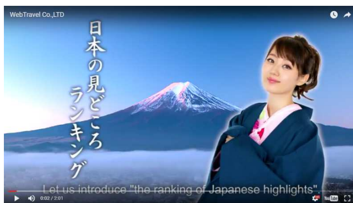
左記サイト内の動画トップページ

2016年10月にグループ入りいたしましたグロリアツアーズは、障がい者スポーツの選手団派遣や国際大会関連の渡航を中心に取扱いしております。障がい者スポーツは、2020年東京オリンピック・パラリンピックに向けて年々関心が高まっており、今後も一層力を入れてまいります。また、その取組みの一環として、パラアスリート協会及び株式会社実業之日本社の協力のもと、パラスポーツ専門誌の発刊なども視野に入れ、障がい者スポーツの認知の拡大と普及に注力をしてまいります。