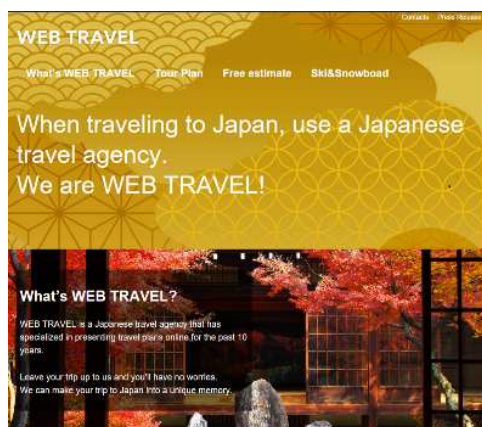
ウェブトラベルのインバウンド用ウェブサイト