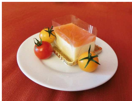
トマトのレアチーズケーキ

ネクスグループにおける「フランチャイズ事業」では、企業向けにパッケージ販売を行い、2016年11月にはシステム導入先の圃場で収穫が開始されました。また、自社圃場におきまして定期的に、特許農法と農業ICTの説明会を開催しており、地方自治体や学校法人から研修の一環として活用されるなど全国各地からの見学や問い合わせをいただいております。