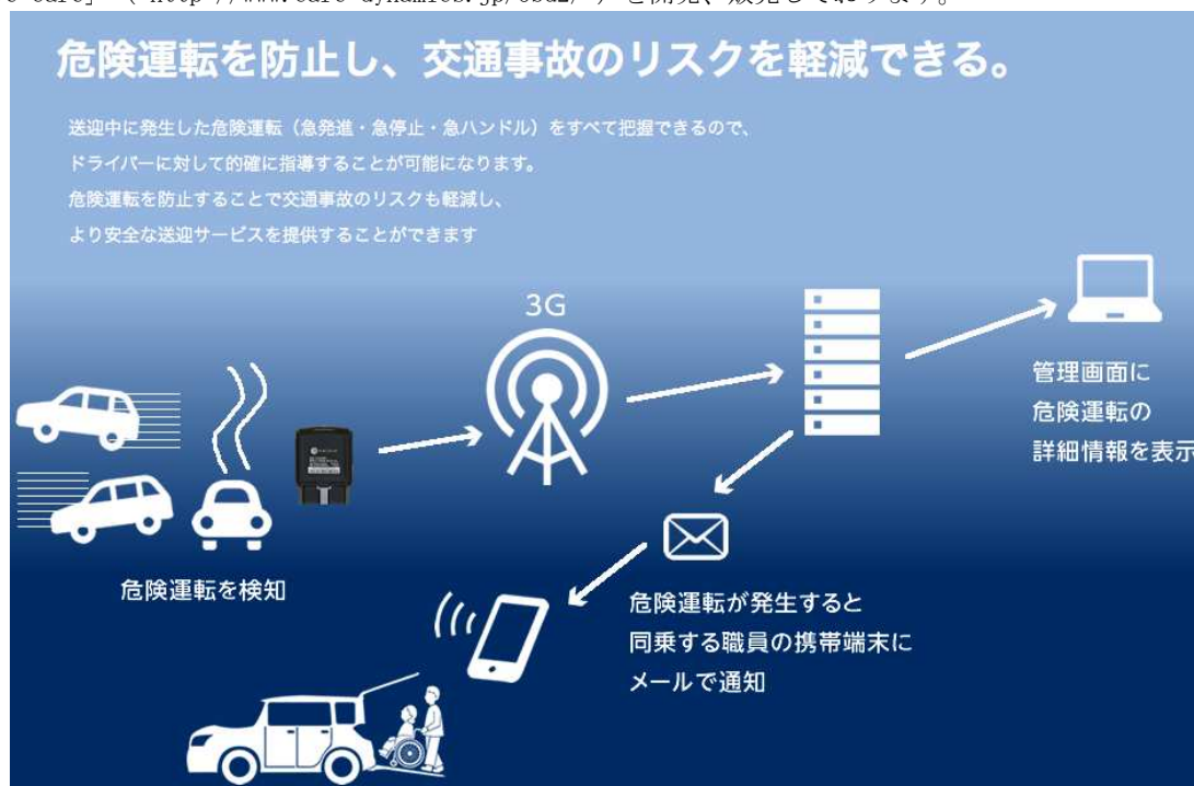
安全運転支援サービス「Drive Care」

2016年8月にはネクス・ソリューションズと共同で、OBDⅡ送迎車用ソリューションである安全運転支援サービス「Drive Care」（ http://www.care-dynamics.jp/obd2/ ）を開発、販売しております。