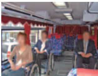
リフト付き車両 イメージ