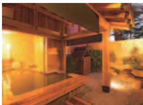
奥日光 小西ホテル