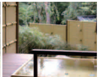
箱根小湧谷温泉 水の音