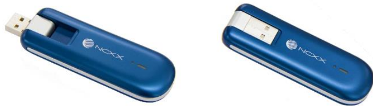
UX302NC-R (ネクス製 LTE/3G USB データ通信端末)