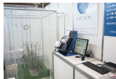
※第1回国際次世代農業EXPO(通称アグリネクスト)の出展ブース

7月には、農業ICTを活用した施設栽培における病気予防策に関して、岩手大学との共同研究を開始いたしました。施設栽培における最も大きな課題の一つである病気の発生を抑えるために、①静電気を利用したカビ胞子の捕集②静電気により発生するイオンを用いたカビ胞子の不活性化の実証実験を行います。ICTシステムにこれらの装置を組み込み制御することで施設内のカビの防除を行うだけでなく、実証試験による研究データの集積により病気発生予測を行い、事前に環境を制御することで、低コストで病気抑制を実現できる施設栽培システムの構築を目指しております。10月には、第1回国際次世代農業EXPO(通称アグリネクスト)に株式会社ネクスの農業ICTシステムの製品を出展いたしました。