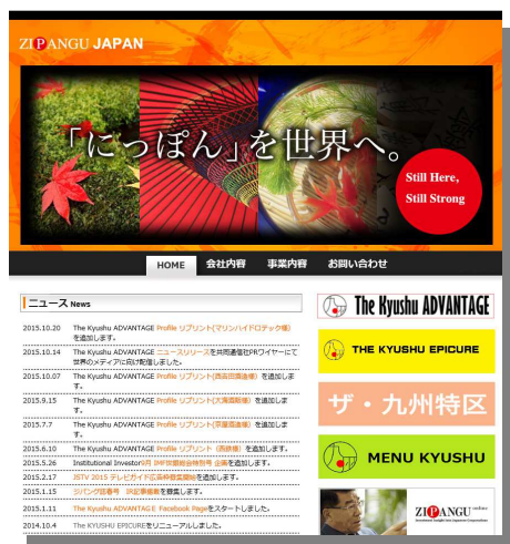
ZIPABGU JAPAN ホームページ

このコンシェルジュ方式の旅行相談を6月にオープンした外国人英語サイトで既に開始しており、今回のジパングジャパンが行っている企業紹介先への訪日旅行や、それに付随する観光などの手配をウェブトラベルで行うものです。特に焼酎は徐々に世界に知れはじめており、ジパングジャパンのサイトから焼酎メーカーへのアプローチなども徐々に増えるものと予測しております。両社はジパングジャパンが発信する「The Kyushu ADVANTAGE」で紹介する企業への訪問や視察旅行、また観光客にも紹介出来る九州を英語サイトで旅行相談に応じ、訪日客にきめ細かな旅行サービスを目指しております。