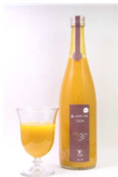
黄いろのトマト100%ジュース

また、トマトを使用した新商品の開発に注力しており、高齢者向けのソフト食としてトマトのレアチーズケーキを開発し、介護施設向けに納品を開始しております。