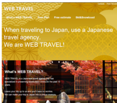
ウェブトラベルのインバウンド用ウェブサイト