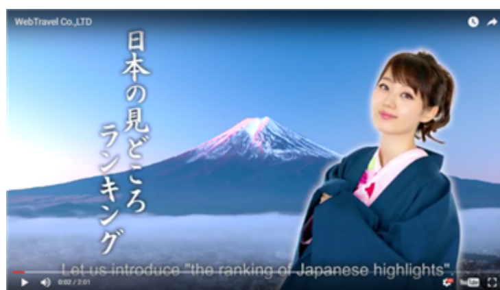
左記サイト内の動画トップページ

2016年10月にグループ入りいたしましたグロリアツアーズは、障がい者スポーツの選手団派遣や国際大会関連の渡航を中心に取り扱っております。障がい者スポーツは、2020年東京オリンピック・パラリンピックに向けて年々関心が高まっており、今後も一層力を入れてまいります。また、その取組みの一環として、パラアスリート協会及び株式会社実業之日本社の協力のもと、パラスポーツ専門誌の発刊なども視野に入れ、障がい者スポーツの認知の拡大と普及に注力をしてまいります。