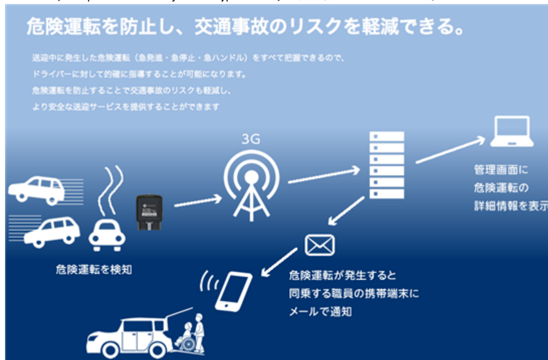
安全運転支援サービス「Drive Care」

2016年8月にはネクス・ソリューションズと共同で、OBD送迎車用ソリューションである安全運転支援サービス「Drive Care」（ http://www.care-dynamics.jp/obd2/ ）を開発、販売しております。