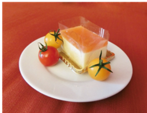
トマトのレアチーズケーキ

ネクスグループにおける「フランチャイズ事業」では、企業向けにパッケージ販売を行い、2016年11月にはシステム導入先の園場で収穫が開始されました。また、自社園場におきまして定期的に、特許農法と農業ICTの説明会を開催しており、地方自治体や学校法人から研修の一環として活用されるなど全国各地からの見学や問い合わせをいただいております。