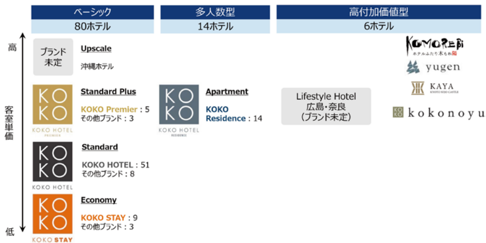
ホテルブランドポートフォリオ

同社の中核事業は国内ホテル運営事業である。全国で展開する同社独自ブランドの宿泊特化型ホテル「KOKO HOTEL」を基軸に、「ベストウェスタンホテル」、東北に展開する中長期滞在型ホテル「パリュー・ザ・ホテル」、さらに高付加価値ホテル分野では特徴のある個別ブランドを創出している。同社はホテルオーナーと運営委託契約あるいは賃貸借契約を締結し、ホテル運営を行う。安定的な収益性が見込まれる自社運営ホテルに関しては、オペレーションのみならずスターアジアグループと共同でホテル不動産に投資するケースもある。いずれのホテルも全国の利便性の高い立地にあり、国内需要だけでなく継続的な訪日外国人旅行者の需要も取り込んでいる。