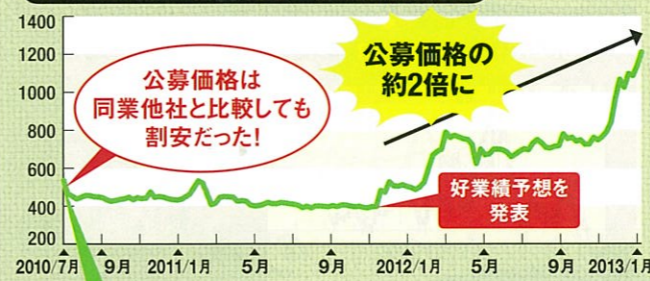
ブライダル会社アイ・ケイ・ケイの株価推移